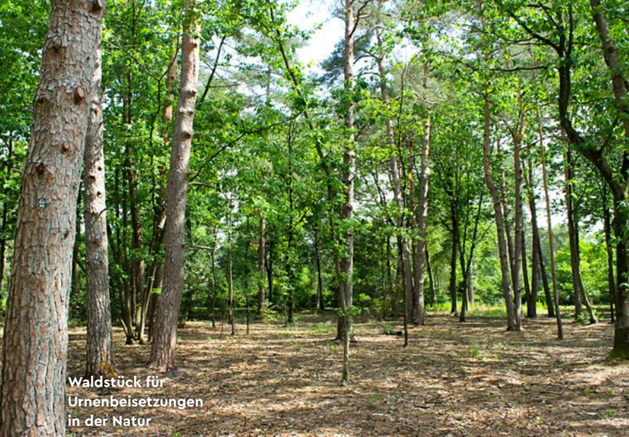
Waldstück für Urnenbeisetzungen in der Natur