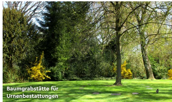
Baumgrabstätte für Urnenbestattungen

Die Pflege der gesamten Anlage erfolgt durch die Friedhofsgärtnerinnen und Friedhofsgärtner des Umweltbetriebs.