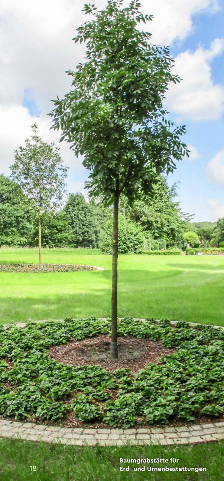
Baumgrabstätte für Erd- und Urnenbestattungen