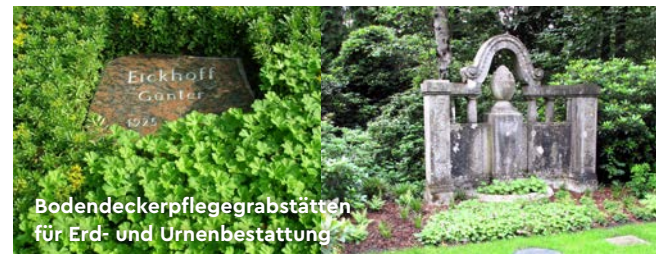
Bodendeckerpflegegrabstätten für Erd- und Urnenbestattung

Anders als bei Rasenpflegegrabstätten liegen diese Grabstätten in einer exklusiv gestalteten Pflanzfläche . Es ist zu beachten, dass Boden- deckerpflegegrabstätten ausschließlich als Reihengrabstätten angeboten werden.