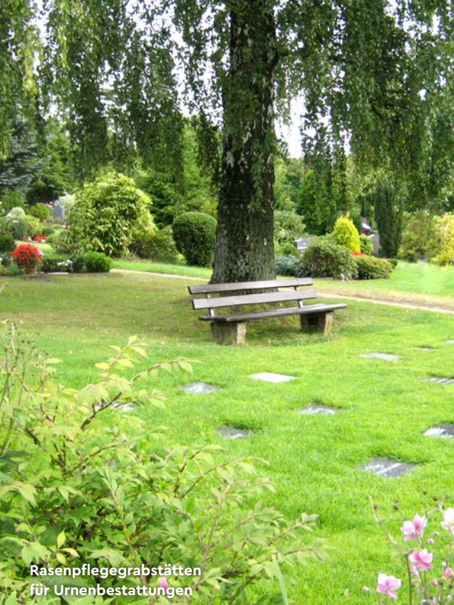
Rasenpflegegrabstätten für Urnenbestattungen